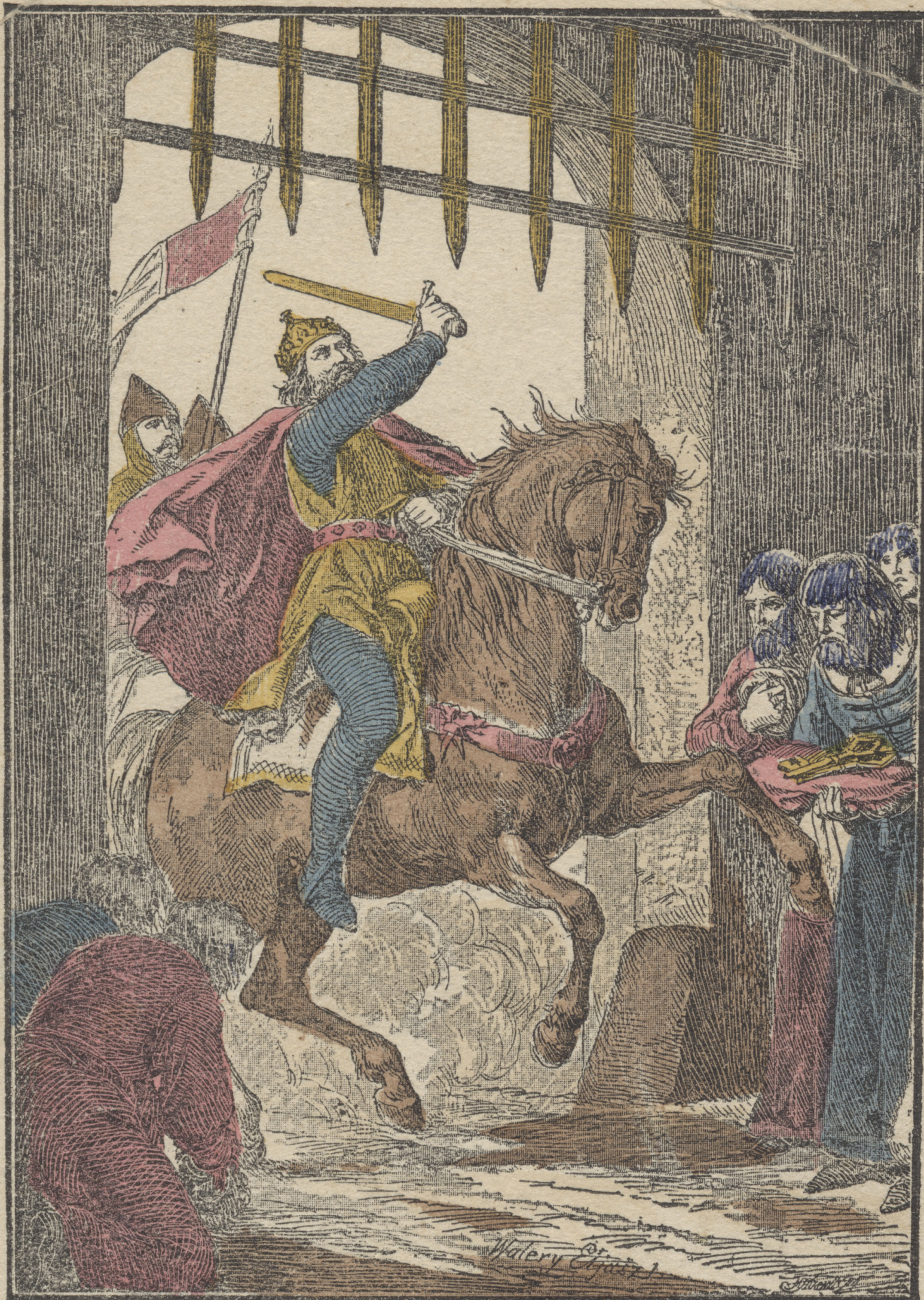
Bolesław Wielki, Król Polski uderza w bramę Kijowa.