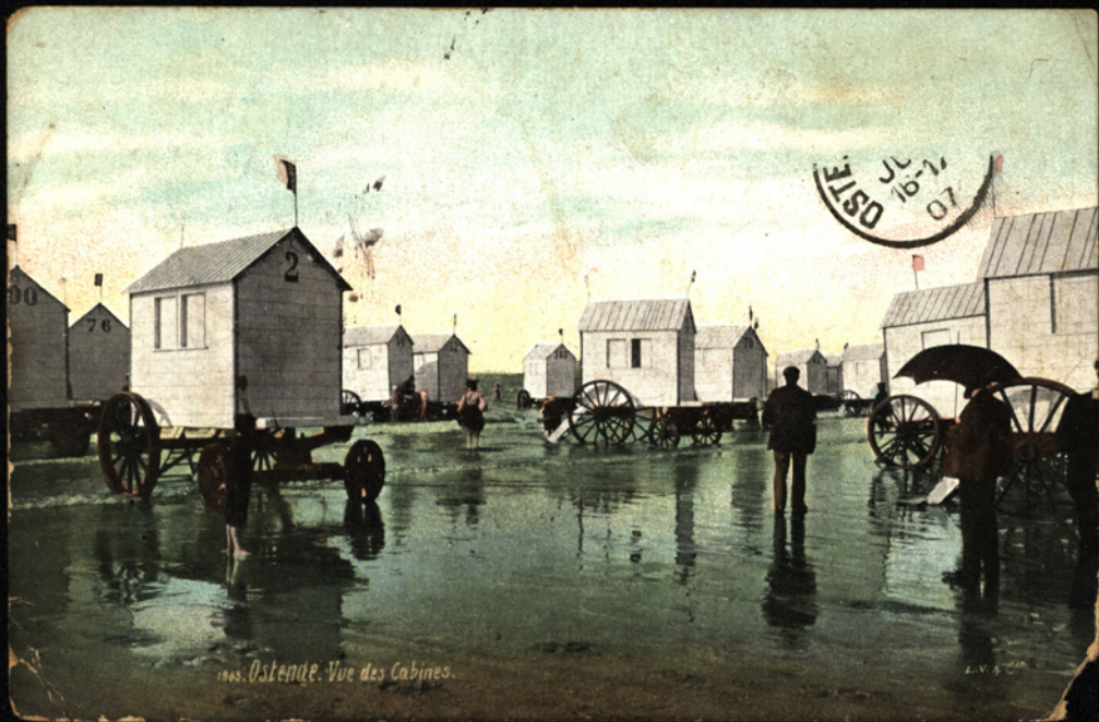
1905. Ostende. Vue des Cabines.